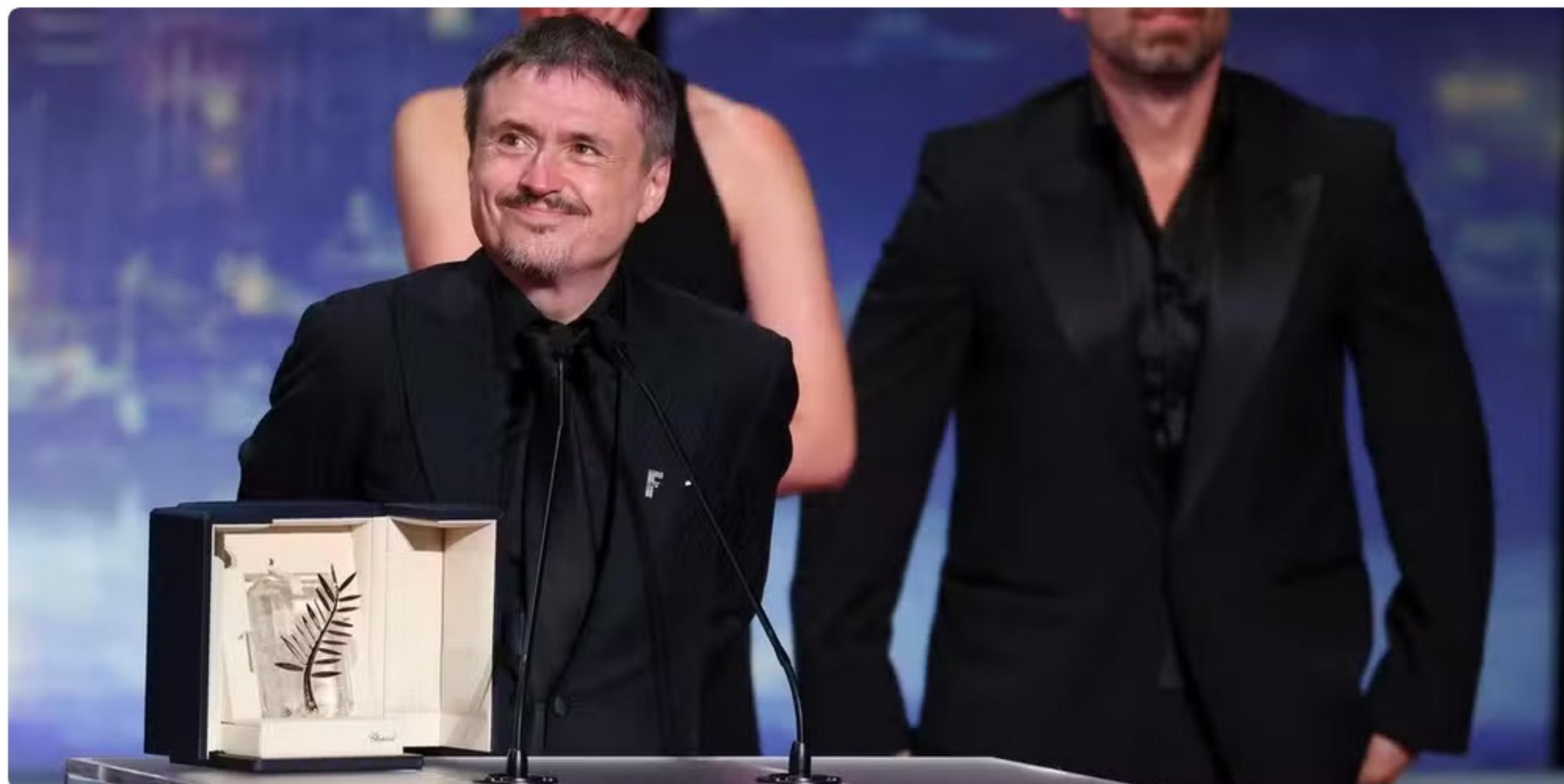
Le réalisateur roumain Cristian Mungiu, Palme d'or à Cannes, sera à La Rochelle fin juin pour la 54e édition du Fema.

Accueil • Charente-Maritime • La Rochelle