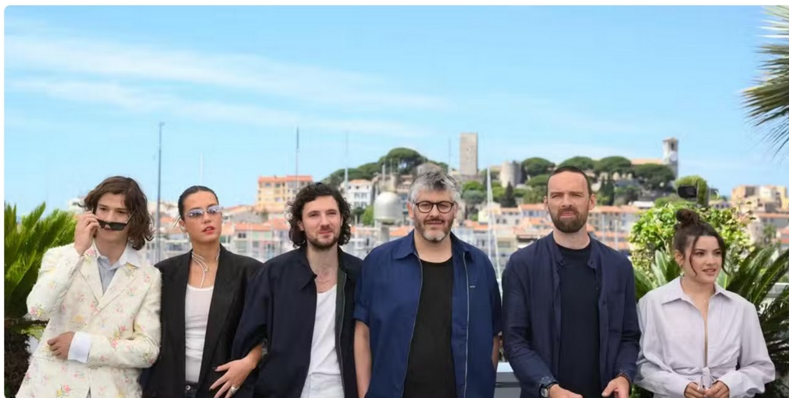
Le réalisateur français Christophe Honoré est attendu sur la croisette rochelaise, lors de la soirée d'ouverture, le 26 juin, avec son nouveau film « Mariage au goût d'orange ».

Accueil • Charente-Maritime • La Rochelle