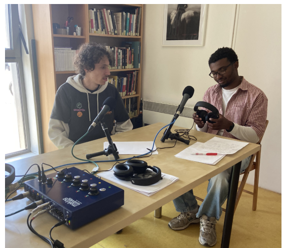
Atelier Radio Box