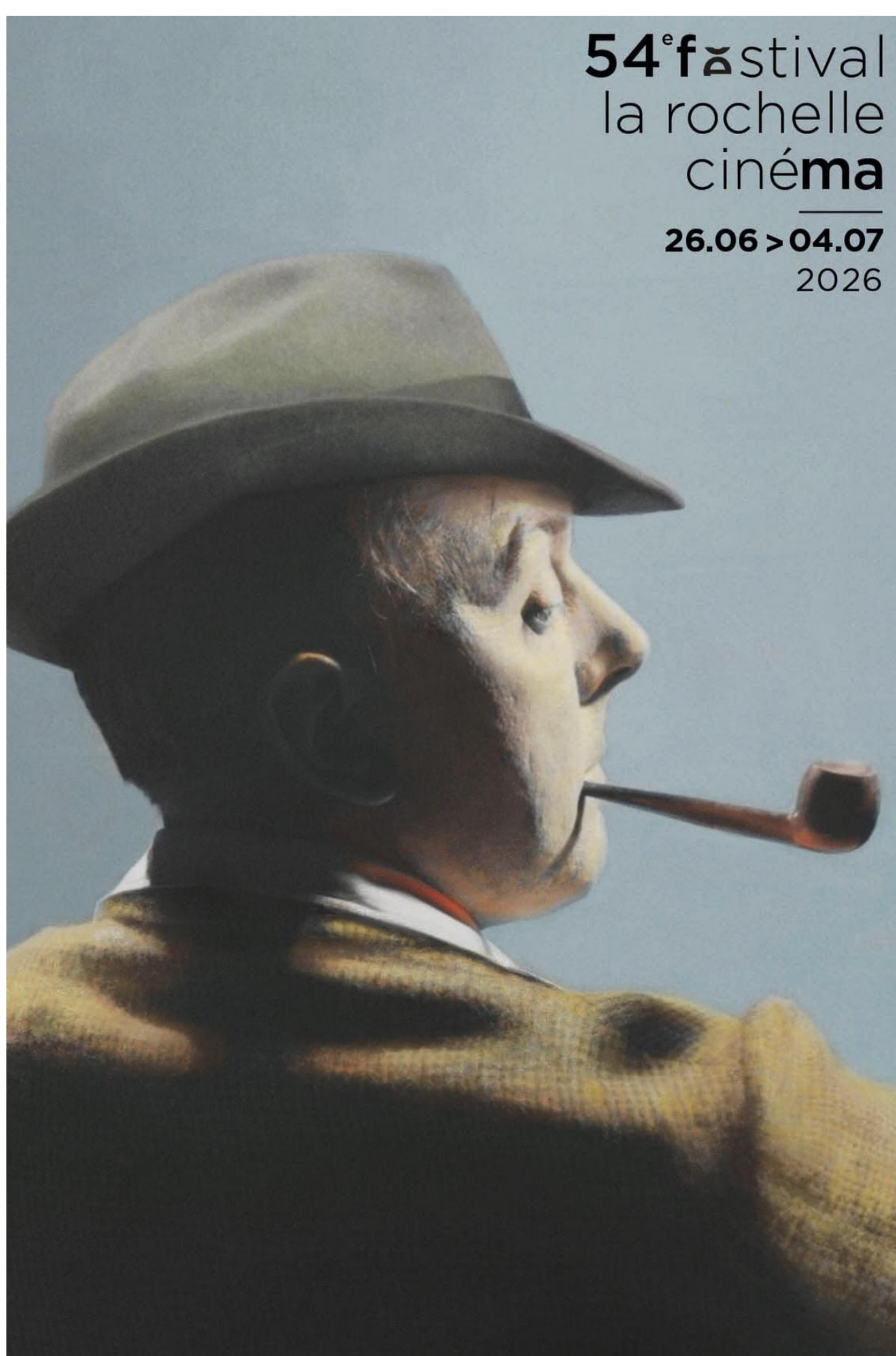
La nouvelle affiche de la 54e affiche. Festival La Rochelle Cinéma