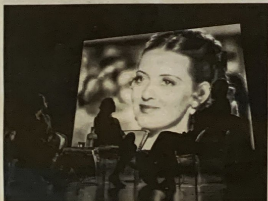
La rétro consacrée à l'actrice américaine, Bette Davis, icône du Hollywood des années 40 à 60.