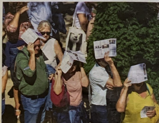
L'incontournable file d'attente des festivaliers devant les salles du Dragon.