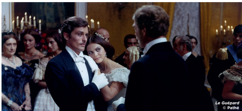
Le Guépard

SAM 02.07 14:00 • GRANDE SALLE - LA COURSIVE