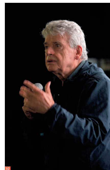
10. Alain Cavalier lors de la discussion suite à la projection de Thérèse