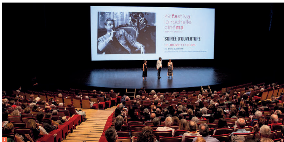
1. Soirée d'ouverture du Festival de Cinéma de La Rochelle et projection du film Le Jour et l'Heure de René Clément

Les Rencontres Patrimoine / Répertoire se sont tenues du 25 au 27 juin à La Rochelle, accueillies par le Festival La Rochelle Cinéma. Elles ont été organisées en partenariat avec l'ADRC.