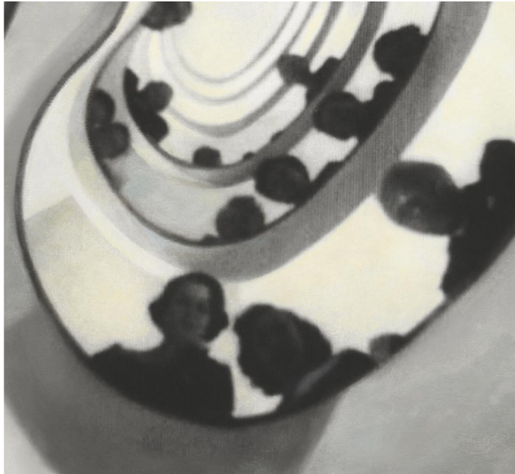
L'affiche de la 49e édition du festival La Rochelle Cinéma Stanislas Bouvier / Fema