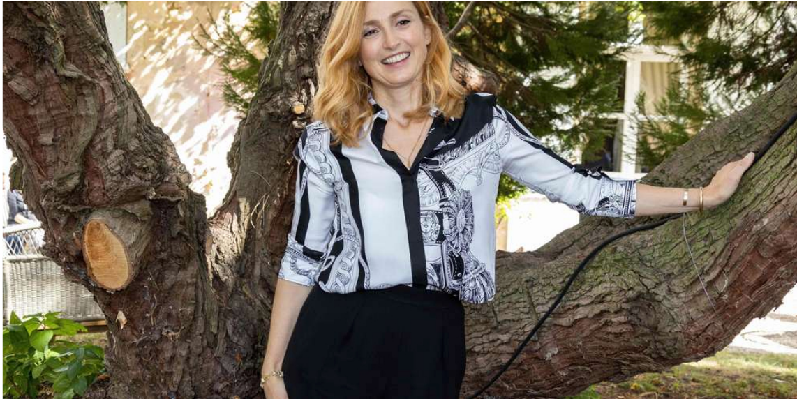
Julie Gayet vient à la rencontre des lycéens de Rochefort dans le cadre d'un forum des métiers du cinéma.