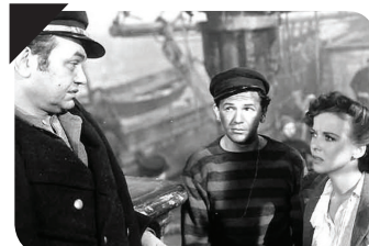
LE VAISSEAU FANTÔME Michael Curtiz