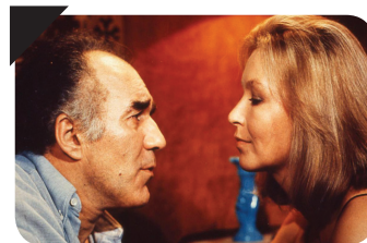
SEPT MORTS SUR ORDONNANCE Jacques Rouffio

France - Espagne - Allemagne / 1975 / 1h46 avec Michel Piccoli, Gérard Depardieu, Jane Birkin