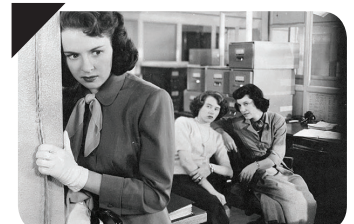
OUTRAGE Ida Lupino

États-Unis / 1950 / 1h15 / version restaurée / vostf / avec Mala Powers, Robert Clarke, Tod Andrews