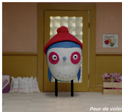
Peur de voler

MAR 30.06 10:45 • JEU 02.07 10:45 • DIM 05.07 10:30