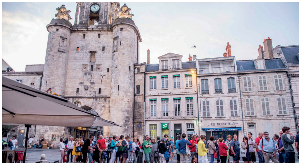
File d'attente pour le Dragon CGR, devant la Tour de l'Horloge de La Rochelle

En 2019, ils rencontreront Dario Argento .